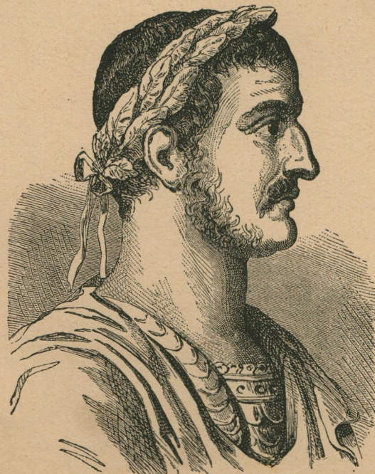
21. — L'empereur Constantin. — Keizer Constantinus.