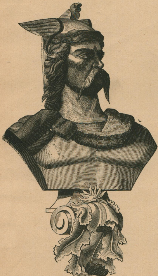
20. — Ambiorix, chef des Eburons. Ambiorix, opperhoofd der Eburonen.