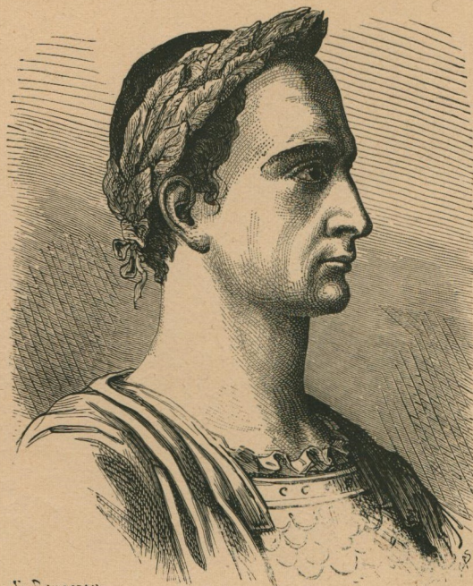
18. — Jules César. — Julius César.